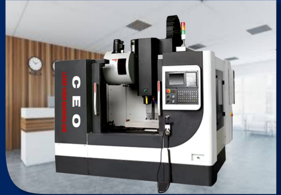
LASER VIBER MARKING PRESS