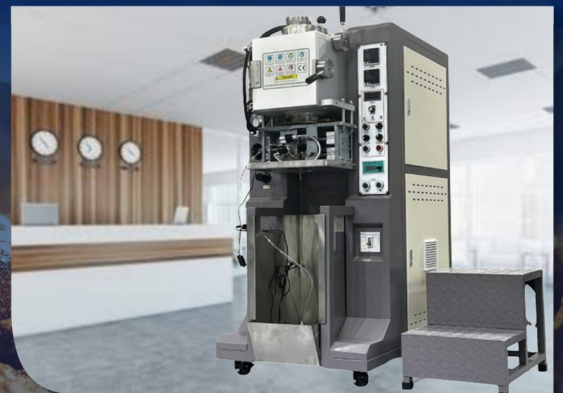
AUTO MAFFLE FURNACE INDUCTION MACHINE