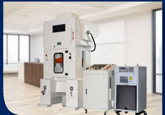
AUTO STAMPLING PRESS HIDROLIC MACHINE