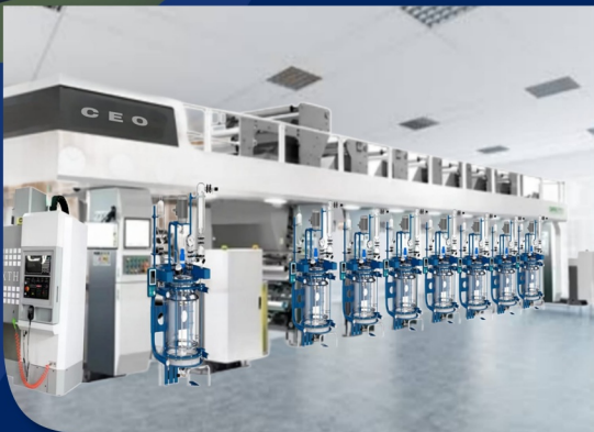
THUMBLER GLASS REFINERY MACHINE