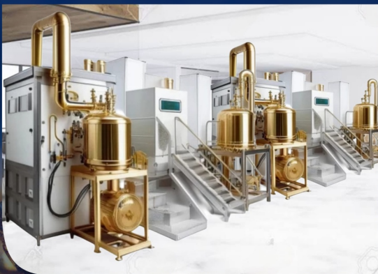
AUTOMATIC THUMBLER REFINERY MACHINE